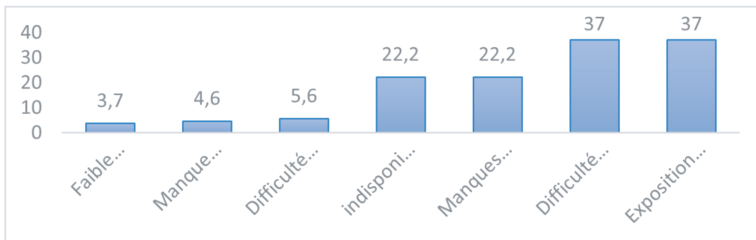
Graphique n°3 : Difficultés rencontrées par les femmes maraîchères dans l'exercice de leurs activités

ver même les produits à vendre (5,6%). Certaines vendeuses déclarent le faible rendement (3,7%).